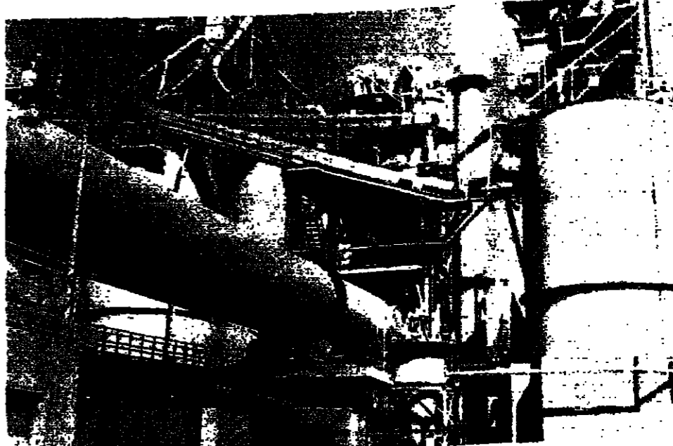
شمار متعددة للتعمية الصناعية في الامارات

حلت استراتيجيية التنمية الصناعية دولة الامارات دفعة قوية لقطاع الصناعات التحويلية، اذ ان زيادة مساهمته في الدخل القومي وتوقيع مصادره. وذكرت دراسة اصدرتها منظمة الخليج للاستشارات الصناعية عن ملامح الاقتصاد الوطني بنبوة الامارات، والمؤشرات الرئيسية للاقتصاد، وشهدتها اتحاد غرف التجارة والصناعة في الامارات، ان انتاج ايو طبري من النفط يبلغ ٨٥٠ وديني ١٠٠ والنفط ٥٪ ويصل احتياطي الغاز في ايو طبري الى ٧٨٪ من انتاج الدولة والياف في دبي. وذكرت الدراسة ان انتاج المحل الاجمالي ارتفع من ٣٩,١٣٥ مليون درهم في عام ١٩٨٠ الى ١١ مليار ٤٧٠ مليون درهم في عام ١٩٨٤، اذ بلغ معدل النمو السنوي ٣٣٪ خلال تلك الفترة. كما ارتفع انتاج التصنيع من النصف المليون من ٢٦ مليار ٣٦٤ مليون درهم عام ١٩٨٠ الى ٧٠ مليار ٥٣٣ مليون درهم في عام ١٩٨٤ بمعدل نمو سنوي ٢٣٪. وزاد الناتج من قطاع الصناعات التحويلية في الفترة نفسها من ٣٦٩ مليون درهم الى ٤ مليارات